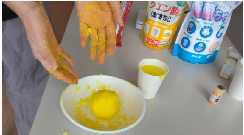
固めるにはコツが必要